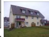
Dänischburger-landstr. in Sereetz