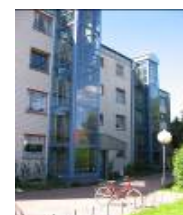
Hohenkrogstr. 5 - 7 in Lensahn