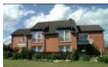
Fasanenweg 4-6 in Ahrensböök