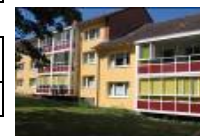
Lerchenfeld 6-16 in Eutin